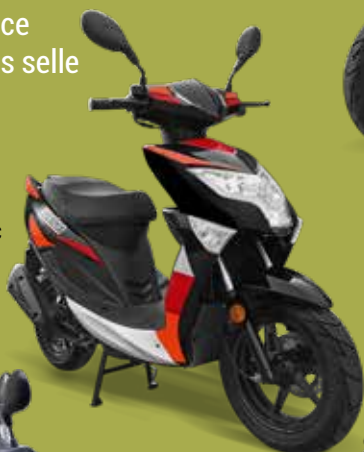
■ Noir / Rouge 12" : 940057C