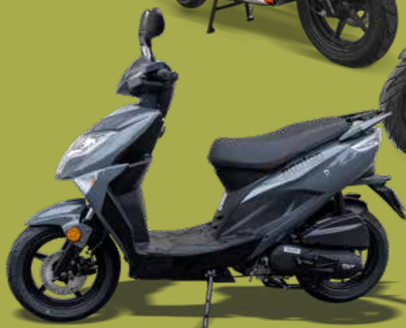
■ Gris Nardo 12" : 940057F