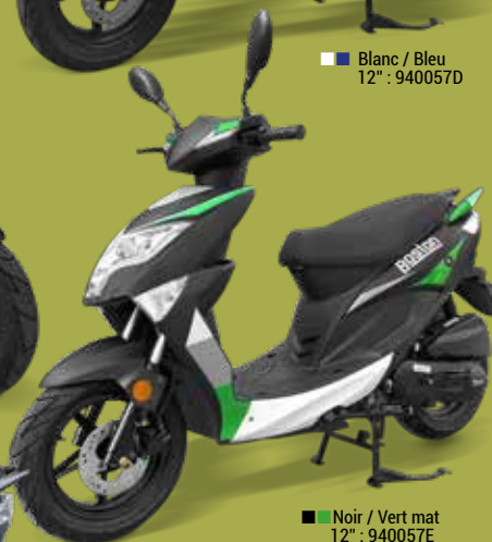
■ Noir / Vert mat 12" : 940057E