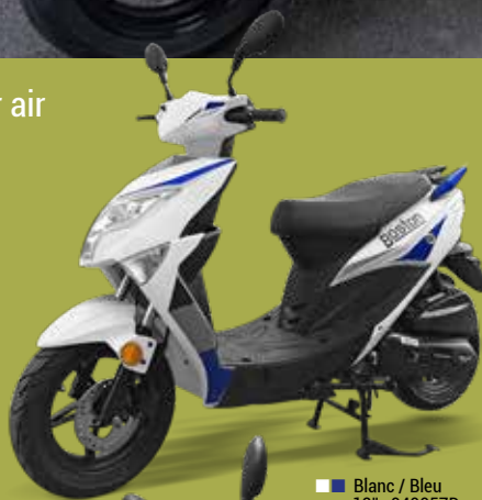
■ Blanc / Bleu 12" : 940057D