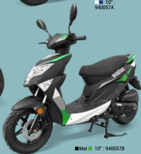
■ Mat ■ 10" : 940057B