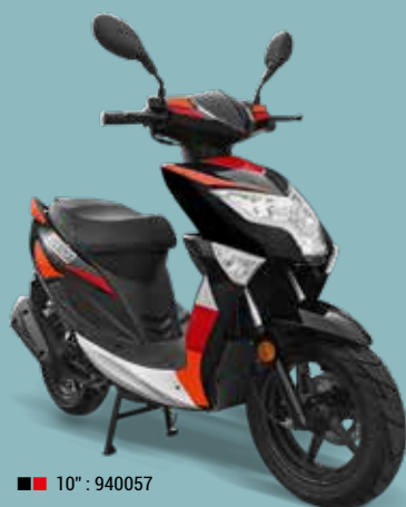
■ 10" : 940057