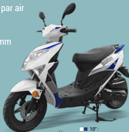
■ 10" : 940057A